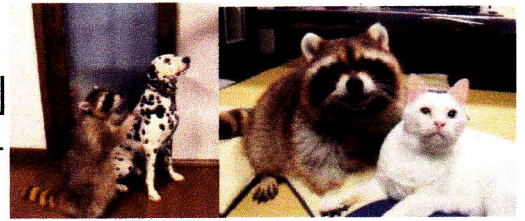
あらいぐま・犬・猫

「法律が変われば行政・警察は変わる」 —2018年動物愛護管理法改正へ向けて・立法提言—